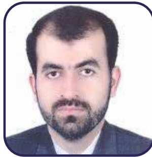
دکتر ابراهیم نعیمی مدیرکل دفتر مشاوره، سلامت و سبک زندگی وزارت علوم، تحقیقات و فناوری